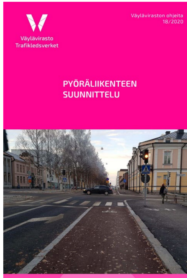
Planering av cykeltrafiken