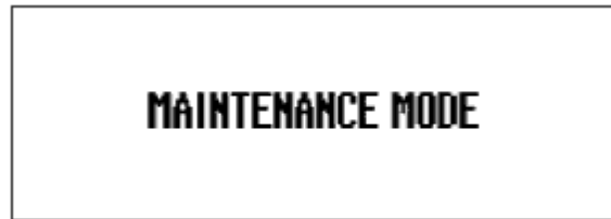
Kuva 3. Auris, Prius ja Prius Plug-in

6. Käynnistä bensiinimoottori: pidä jarrupoljinta painettuna ja paina POWER nappulaa. Mittaristoon syttyy READY-valo.