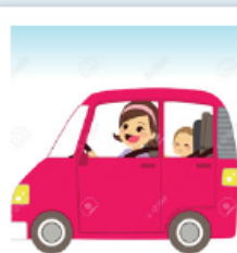
Alle 135 cm lapsi turvaistuimessa