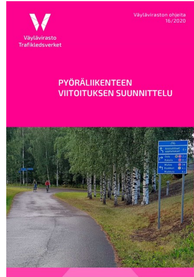
Pyöräliikenteen viitoituksen suunnittelu