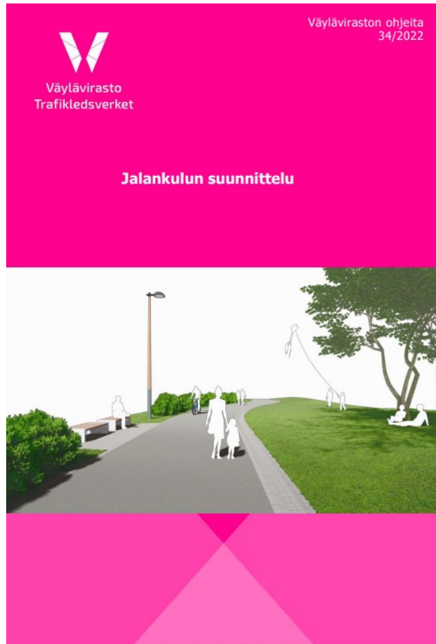
Planeringsanvisningar för gångtrafiken