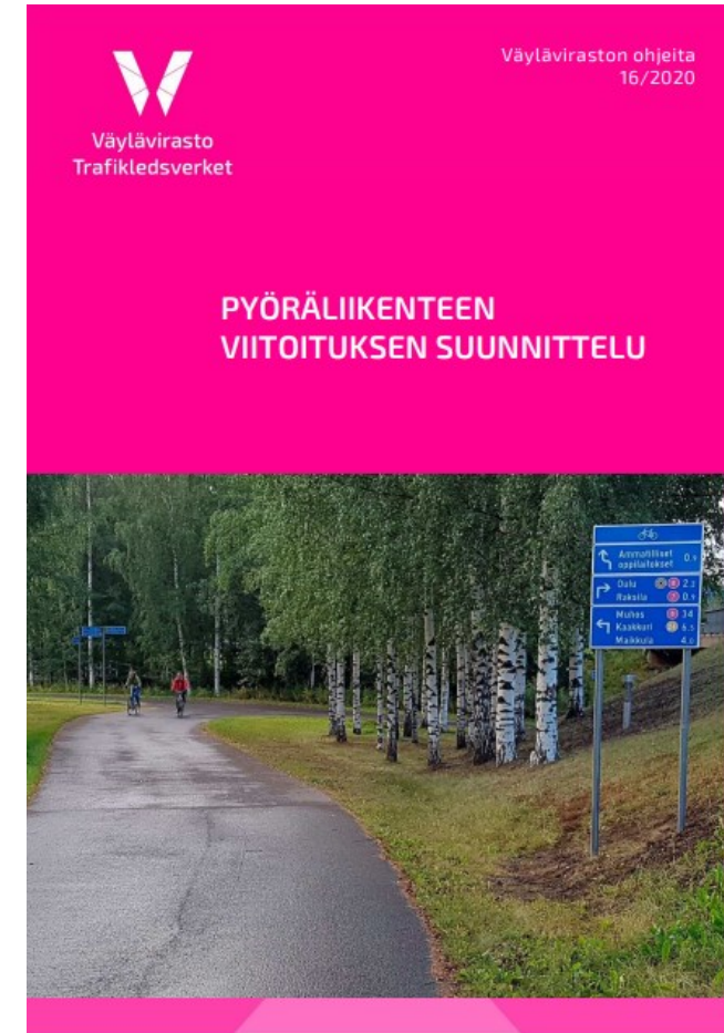
Planering av vägvisning för cykeltrafiken

Stödmaterialet för sökande (sidorna 9 och 10) innehåller riktlinjer som preciserar planeringsanvisningarna för cykeltrafiken.