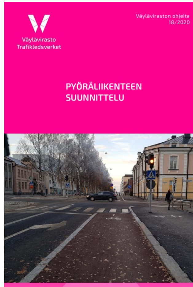
Planering av cykeltrafiken