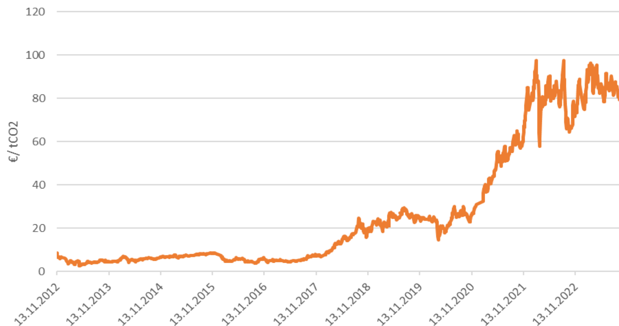
Auktionspriset av utsläppsrätter 13.11.2012 – 9.11.2023 (EEX)