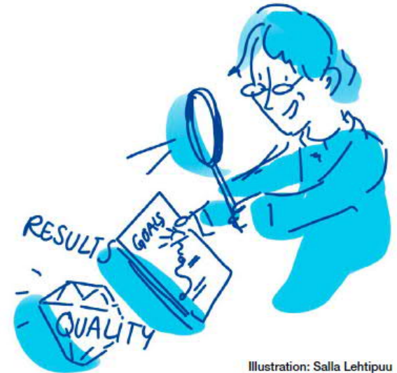
Illustration: Salla Lehtipuu