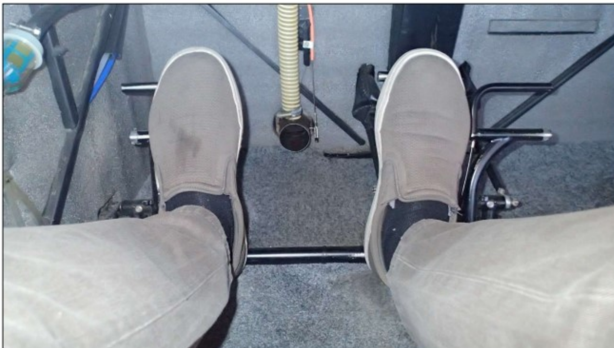
Kuva 2. Kuva polkimista sekä oikein asetetusta jaloista.