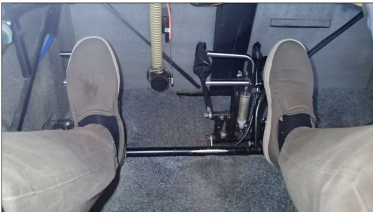
Kuva 3. Kuva polkimista ja oikean jalan virheasennosta.

Kuva 3. Poljinten sijainti mallissa Evekter Aerotechnic EV-97 EUROSTAR, Model 2000, Version R (OTKES, tutkintaselostus L2019-05)