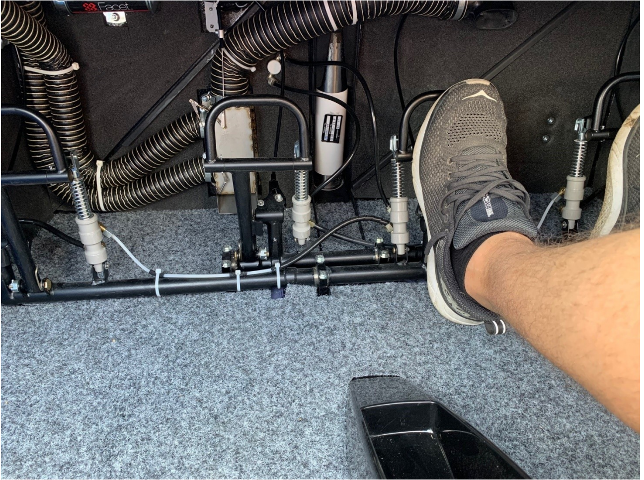
Kuva 1. Eurostar SLW -mallin poljinjärjestely.